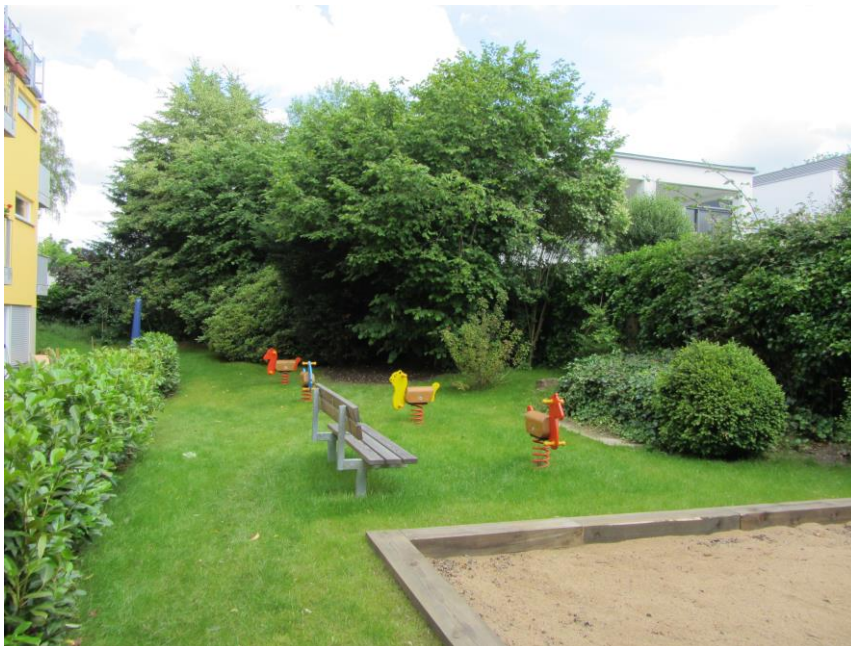
Garten hinter dem Haus

Für weitere Informationen sowie die Vereinbarung von Besichtigungsterminen sind wir für Sie telefonisch unter 0 22 02 - 95 22 20 erreichbar!