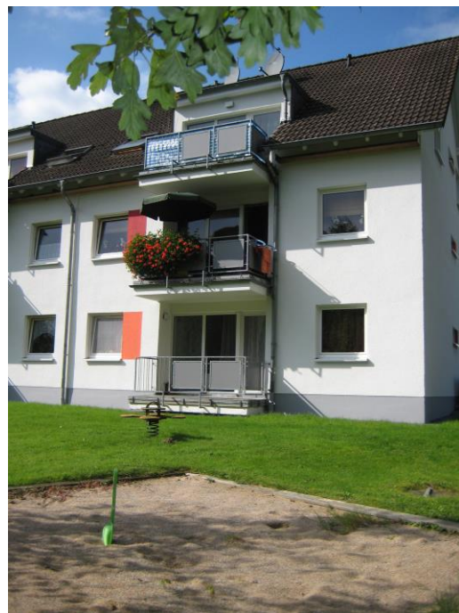
Spielplatz am Haus

Hinweis: Unsere Angebote sind freibleibend und unverbindlich. Wir behalten uns vor, unsere Angebote ohne gesonderte Ankündigung zu verändern, zu ergänzen, zu löschen oder die Veröffentlichung zeitweise oder endgültig einzustellen. Zwischenvermietung behalten wir uns ausdrücklich vor.