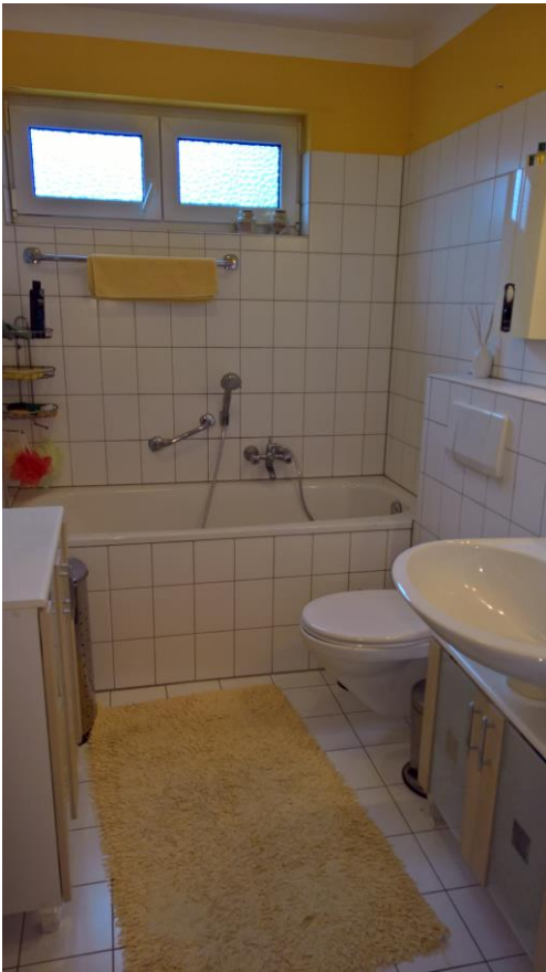
Bad mit Wanne und Fenster