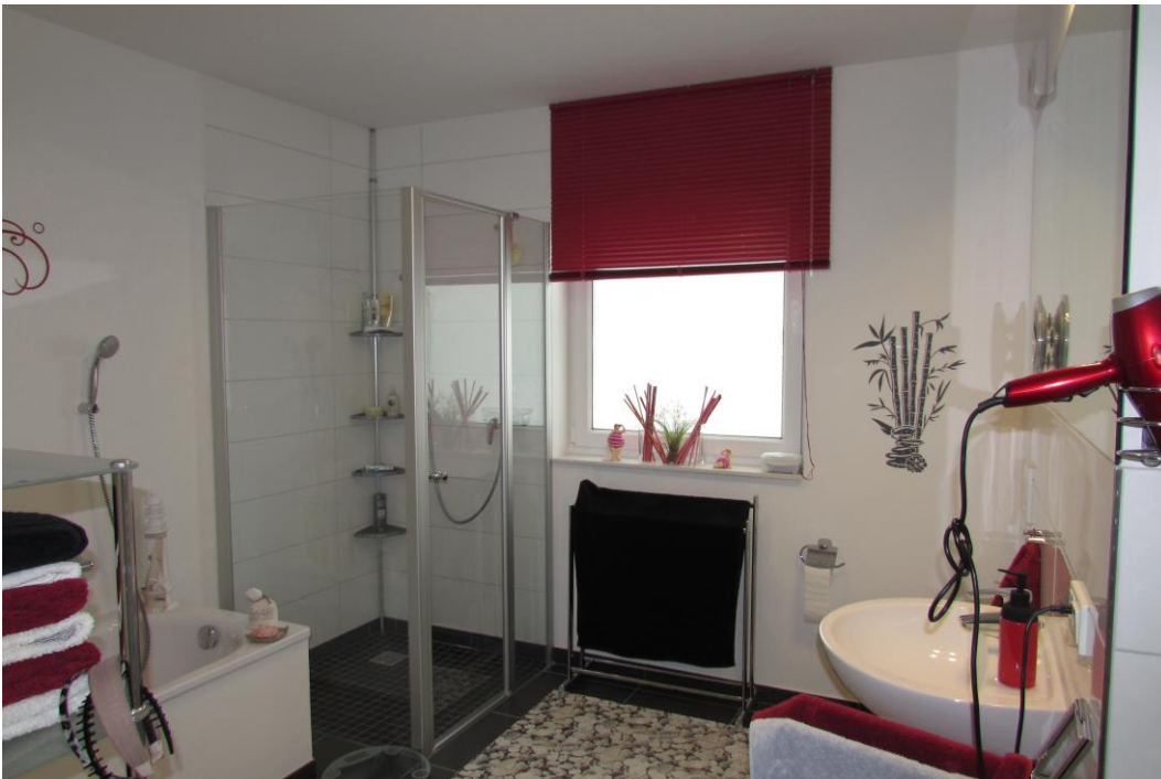
Bad mit großer Dusche und Fenster