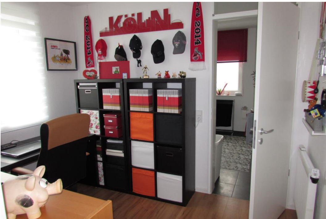
Beispiel: Alternativ als Arbeitszimmer

Für weitere Informationen sowie die Vereinbarung von Besichtigungsterminen sind wir für Sie telefonisch unter 0 22 02 - 95 22 22 erreichbar!