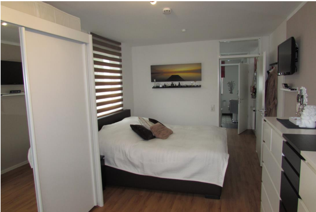
Beispiel: Schlafzimmer mit Durchgang zum Ankleideraum und Bad