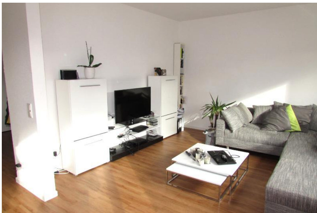
Ansicht potientiellles Wohnzimmer