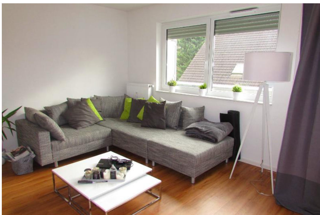
Ansicht potientiellles Wohnzimmer

Für weitere Informationen sowie die Vereinbarung von Besichtigungsterminen sind wir für Sie telefonisch unter 0 22 02 - 95 22 22 erreichbar!