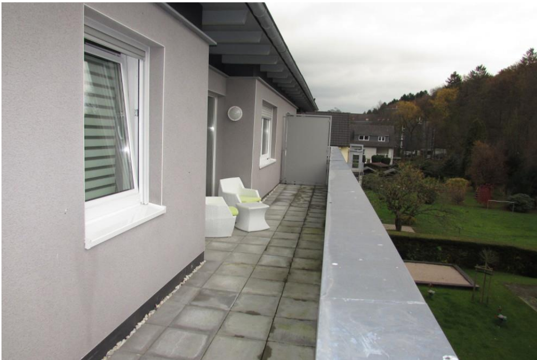
Ansicht Balkon / Terrasse