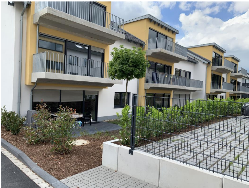
Ansicht Hausrückseite Maria-Juchacz-Str. 10-12

Für weitere Informationen sowie die Vereinbarung von Besichtigungsterminen sind wir für Sie telefonisch unter 0 22 02 - 95 22 22 erreichbar!