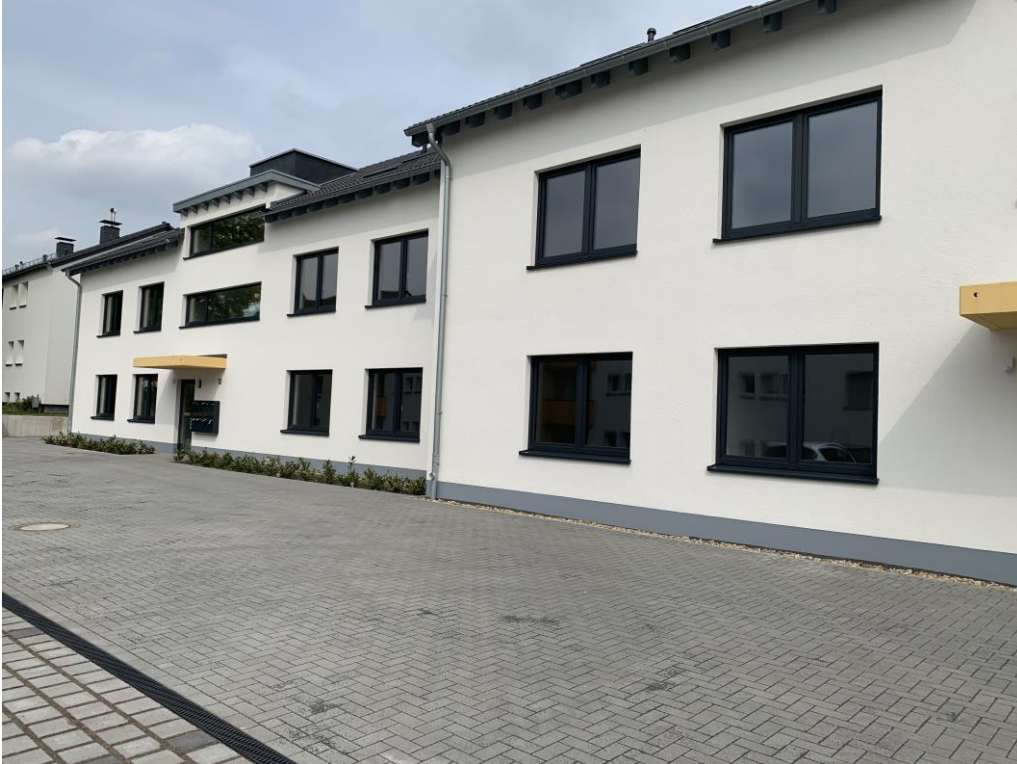
Ansicht Hauszugang Maria-Juchacz-Str. 10-12