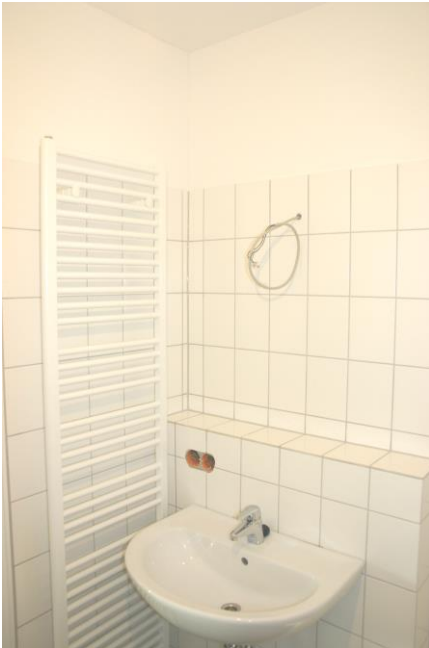
Modernes Bad mit Handtuchhalter