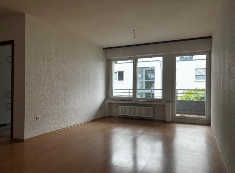
Wohnzimmer Foto 1 (Exemplarisch)