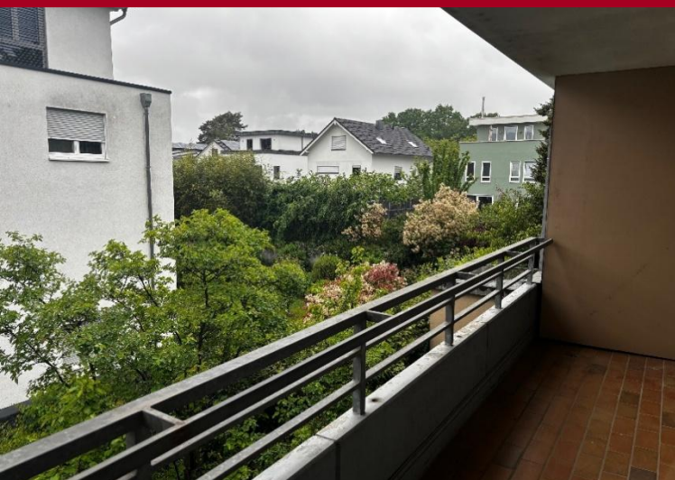
Blick von der Loggia (Exemplarisch)